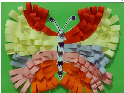
Sofija Pintarič, 1. g