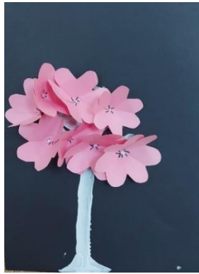
Sofija Pintarič, 1. g