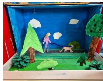
Teja Preložnik, GOZD